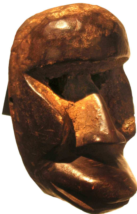
Maschera Dan Kran, Liberia Legno, 14 cm