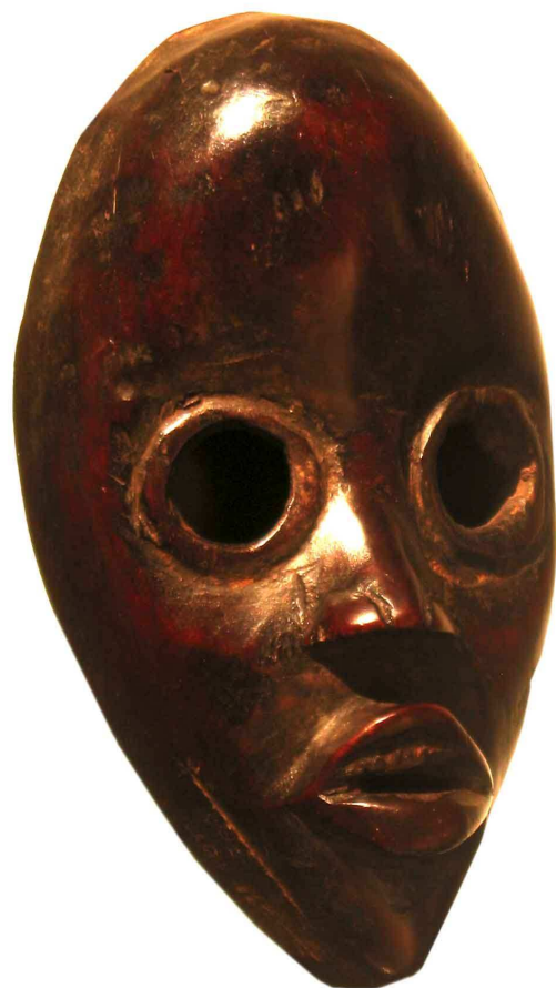
Maschera Dan, Costa d'Avorio Legno 13 cm