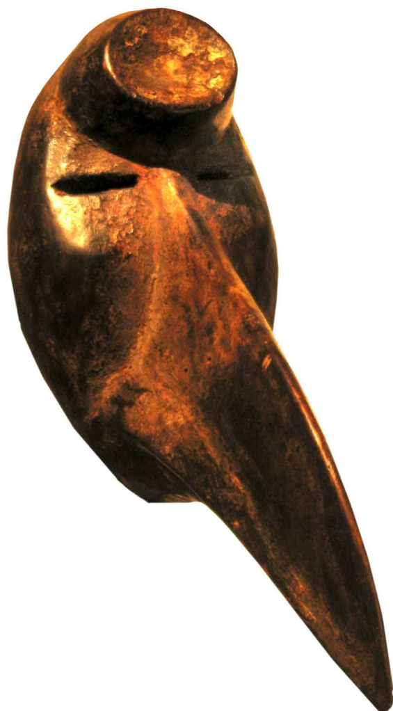
Maschera Dan, Liberia Legno, 15 cm