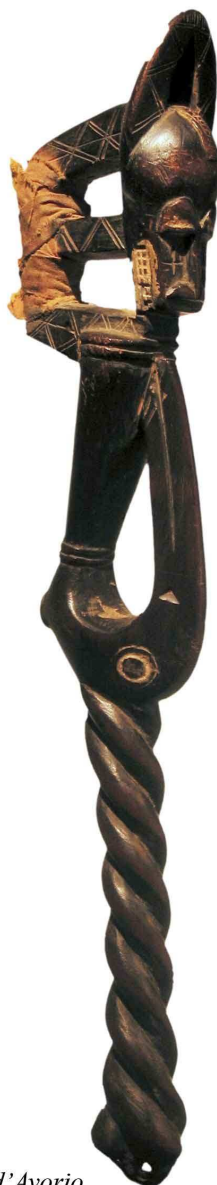
Martello da Musica Baule, Costa d'Avorio Legno e pigmenti, 31 cm