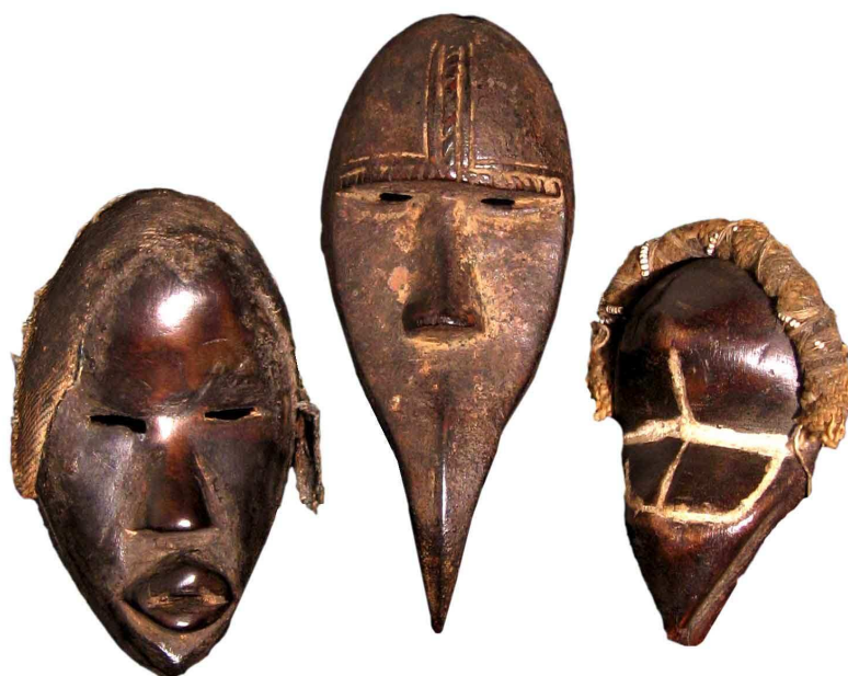
Maschere in miniatura Dan, Costa d'Avorio Legno, 13, 16, 11 cm