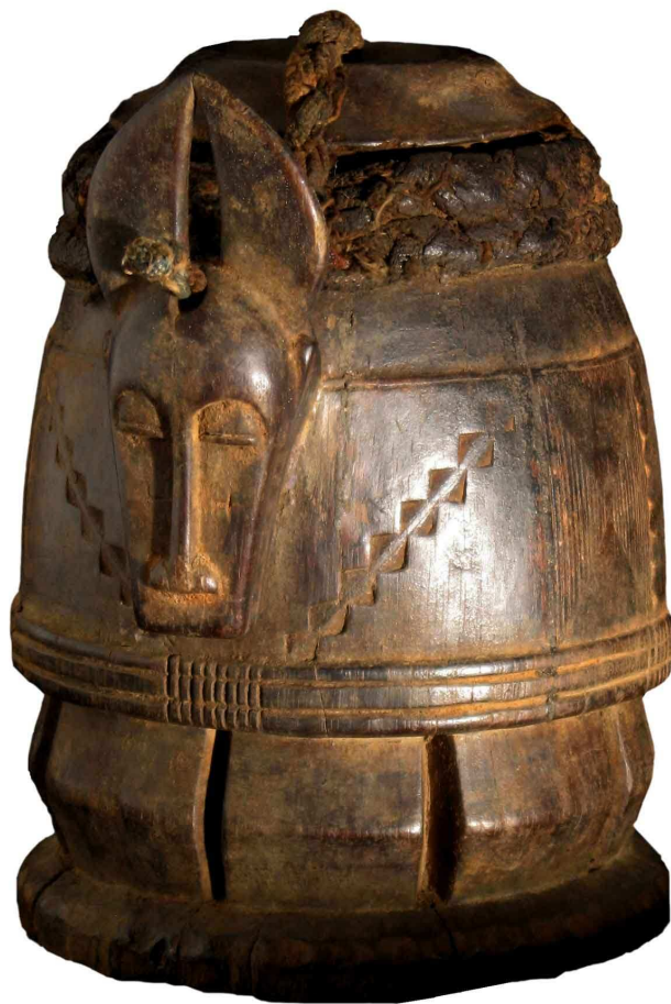
Scatola da oracolo Baule, Costa d'Avorio Legno e pelle, 23 cm